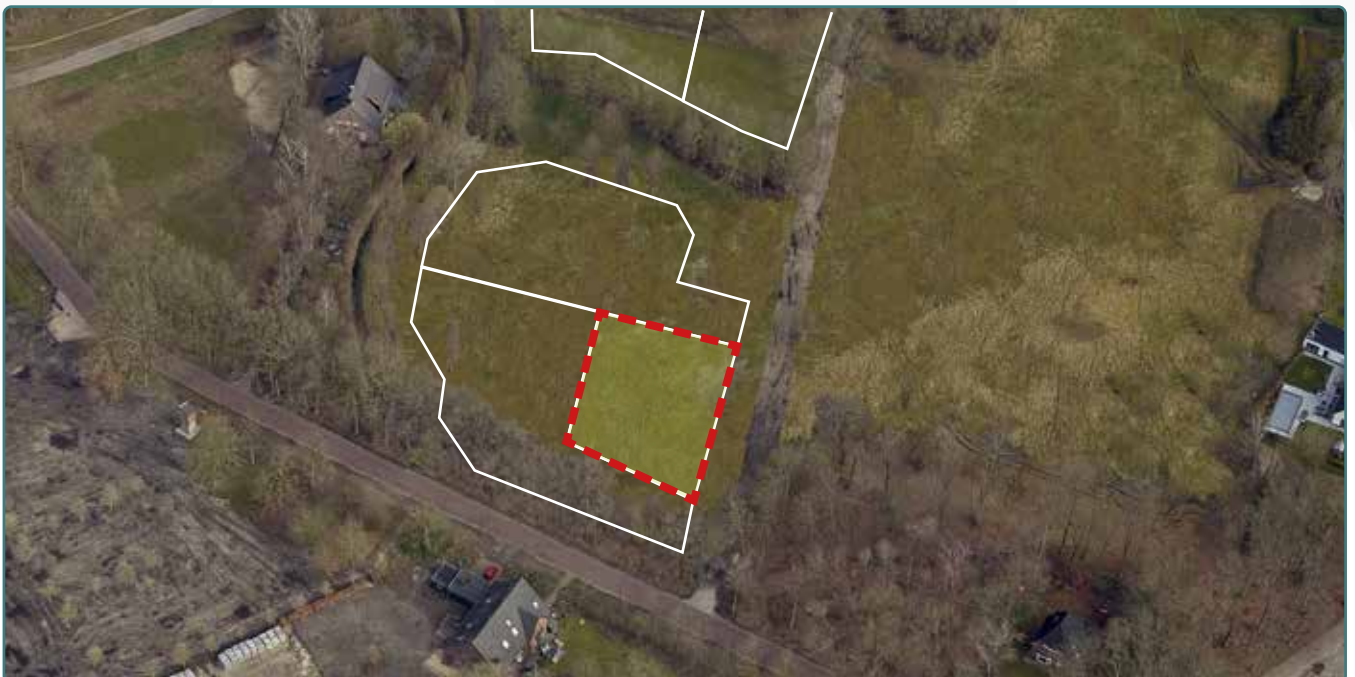
Kavel 161 vanuit de lucht